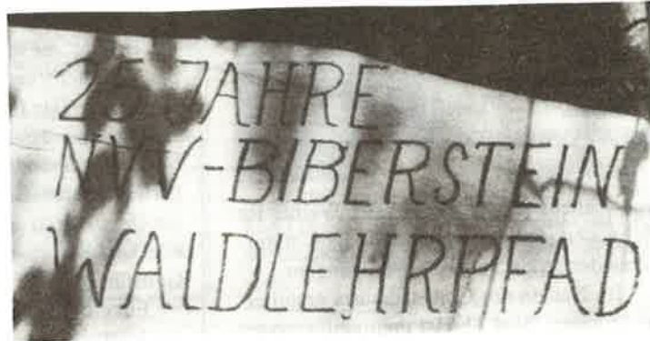
Eine Hinweis- und Erinnerungstafel lädt zum Rundgang ein.

Am letzten Samstag feierte der Natur- und Vogelschutzverein Biberstein sein 25jähriges Jubiläum. Er gestaltete dies auf vielseitige Weise.