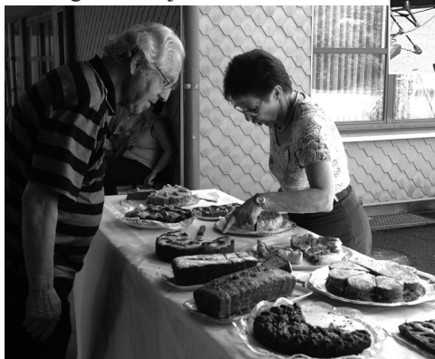
Bild links: Ein feines Stück Kuchen ... Welches soll's denn sein?

Schnee- und Eisfreie gedeckte Parkplätze